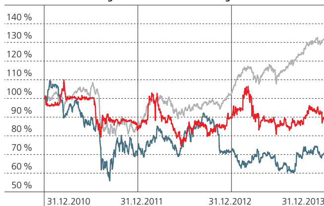
Die Aktie der MVV Energie AG im Performance-Vergleich über 3 Jahre

■ MVV Energie AG ■ DAXsector Utilities ■ SDAX